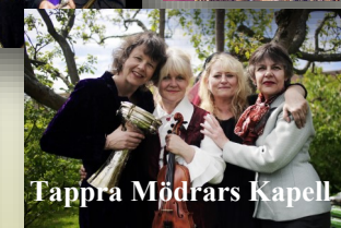
Tappra Mödrars Kapell