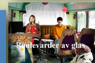
Boulevarder av glas