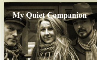
My Quiet Companion