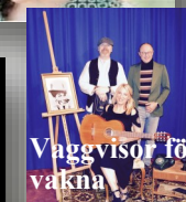
Vagvisor för vakna