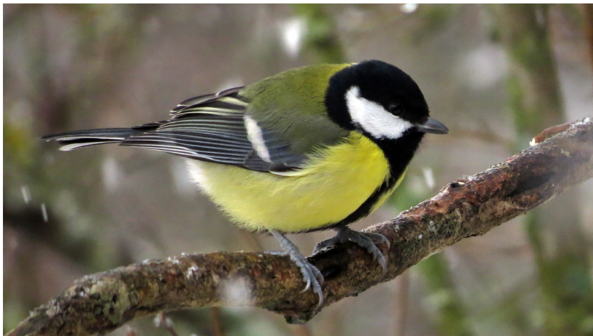
Foton från Sörbygden 08.