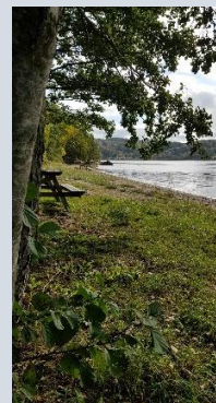
Maltes stig - Saltkällan! Må bra på hälsans stig! Barnvagns- och rullstolsvänligt! Grillplatser och sittbänkar!