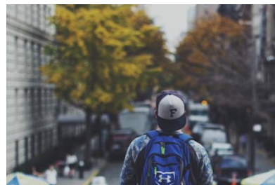
Grupp-föräldrar till barn/unga med NPF

Kommunen erbjuder dig en grupp på nätet via e-tjänsten En bra plats™ där du kan dela dina tankar, frågor och känslor tillsammans med andra i liknande situation. Du kan vara helt anonym och har tillgång till olika "Temagrupper" när det passar dig (här visas tre exempel/bilder på temagrupper). För mer information och anmälan: www.enbraplats.se