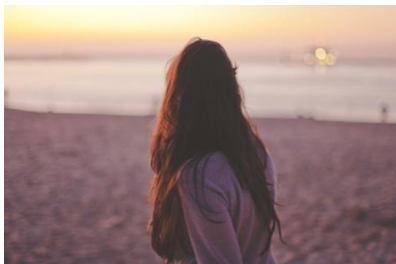
Anhöriggrupp för cancerberörda