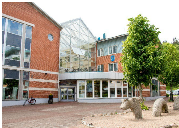
Kommunhuset Forum maj 2018

Enligt tidplanen skall nämnderna ta ställning till en budgetskrivelse för budget 2024 senast i maj. Kommunstyrelsen kommer att följa budgetarbetet i nämnderna (dialogmöten).