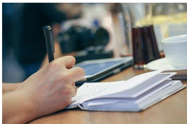
Möte, fotograf Lotta Karlsson

Förändrad ram för Överförmyndarnämnden med 0,150 mnkr. Valnämnden som får en ramminskning på 0,300 mnkr då kommunvalet var 2018. Det kvarstår 0,100 mnkr till europavalet 2019.