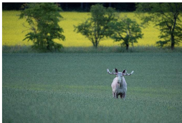
Vit älg.

Samtliga dokument som ligger på löneenhetens hemsida ska en gång per år gås igenom och vid behov revideras