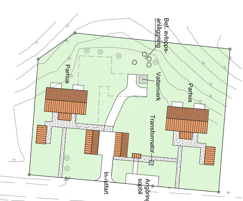
ILLUSTRATION 2. Skala 1:1000 (A3) Alternativ med bostäder. 2 st parhus samt kompletterbyggnader.