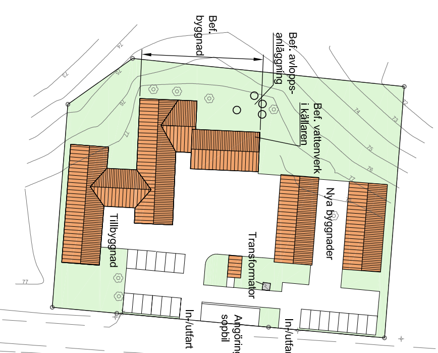
ILLUSTRATION 1. Skala 1:1000 (A3) Alternativ med verksamheter. Befintlig byggnad kompletterad.

Mats Tillander Munkedals kommun PLANKARTA Aktr. 1430-P94