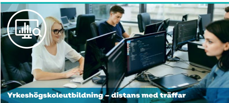
Yrkehögskoleutbildning – distans med träffar

Antal veckor: 60-100, beroende på förkunskaper.