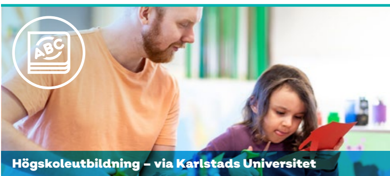
Högskoleutbildning – via Karlstads Universitet