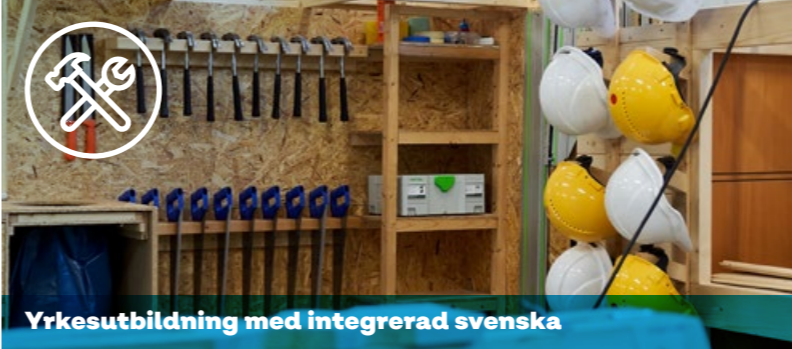
Yrkesutbildning med integrerad svenska