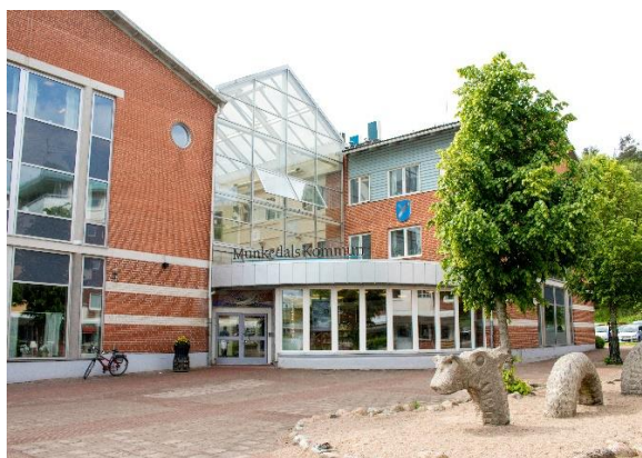
Kommunhuset Forum maj 2018

Förvaltningschef: Liselott Sörensen-Ringi