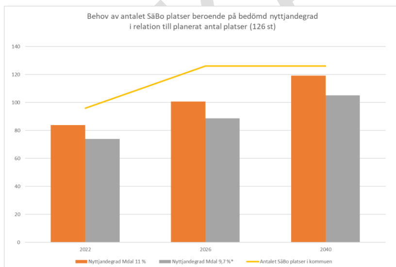
Figur 3 - Behov av SäBo-platser beroende på bedömd nyttjandegrad i relation till planerat antal platser

Om kommunen bygger sju nya avdelningar, vilket innebär 84 nya platser på särskilt boende, i tillägg till 42 befintliga platser (Dinglegården 14 platser, Sörbygården 28 platser, Allégården avvecklas), får kommunen totalt 126 platser. Det kan innebära ett överskott på 7–21 platser år 2040.