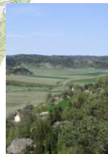
Vy över dalen norrut från Låssby

Det är ditt ansvar att försöka se till att det du gör smälter bra in i landskapet, ser vackert ut och inte sänker värdet på den kulturmiljö du bor i - vårt gemensammakulturarv. Det viktigaste är att man tänker efter före och använder sina pengar och egna och andras kunskaper på rätt sätt. Dra dig inte för att kontakta någon med specialkunskaper på området, det finns goda råd att få på nära håll - helt gratis!