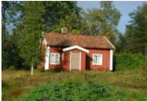
Torpet Pulsevadet, som förvaltas av Svarteborgs hembygdsförening, är välbevarat både ut- och invändigt

En byggnad av särskilt intresse inom området är herrgården i Påstigen, en salsbyggnad från 1850-talet med en imponerande entré under tak med tempelgavelfront, uppburen av fyra kolonner. En vacker allé leder också fram till huset. I närheten av herrgården finns ett äldre hus av helt annan karaktär, ett sambyggt bostads- /uthus klätt med faluröd locklistpanel.