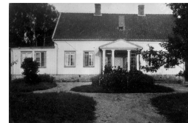
Herrgården i Påstigen är en så kallad salsbyggnad. Fotot är troligen taget på 50-talet.