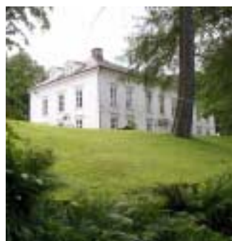
Mangårdsbyggnaden på Torp