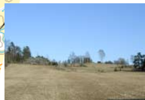
Kulturlandskapet kring Torp är rikt på fornlämningar

Kartutsnittet ovan visar hur den miljö är avgränsad som är utpekad som kulturhistoriskt värdefull i kommunens kulturminnesvårdsprogram från 1995