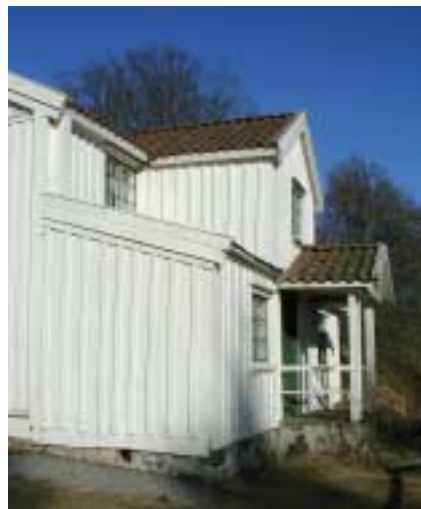
Det äldre manhuset på Torp är i sina äldsta delar från senare hälften av 1700-talet. Delar av interiören är bevarad. Det är högt beläget med utsikt mot söder över dalgångslandskapet.

Kommunens kulturminnesvårdsprogram lyfter fram det här området som en kulturhistorisk miljö av stort värde på sina många lämningar från järnålder och framåt samt dess tradition knuten till de norska kungasagorna - Haakon Härdabreds saga och Sverres saga. De förhistoriska lämningarna, bebyggelsen, stenvalvbron och lämningarna vid älven är tillsammans med det öppna landskapet viktiga att bevara. Ny bebyggelse bör enligt programmet underordna sig traditionen vad gäller placering och utformning. Den äldre bebyggelsen bör också underhållas på ett bra sätt. Det är också av stor vikt att öppna betes- och jordbruksmarker bibehålls.