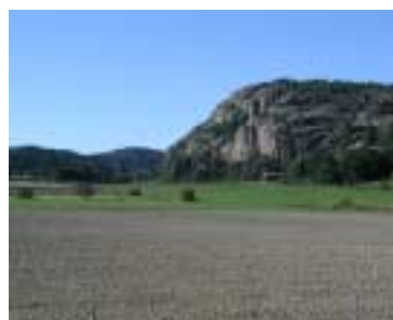
I läget för trafikplats Dingle upptäcktes 1997 en stormannagård från järnåldern. Vy från trafikplatsen mot Buråsen