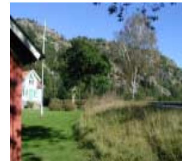
Puttarna intill väg 174 med Buråsareberget i bakgrunden