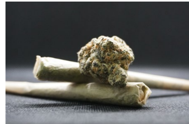
Så kallad "joint" där cannabis rullas i cigarettapper.