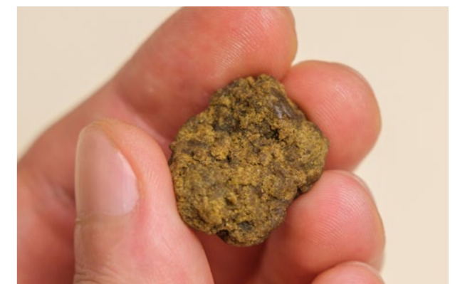
En bit av en haschkaka.