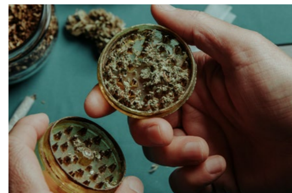
En "grinder" finfördelar marijuana innan rökning.