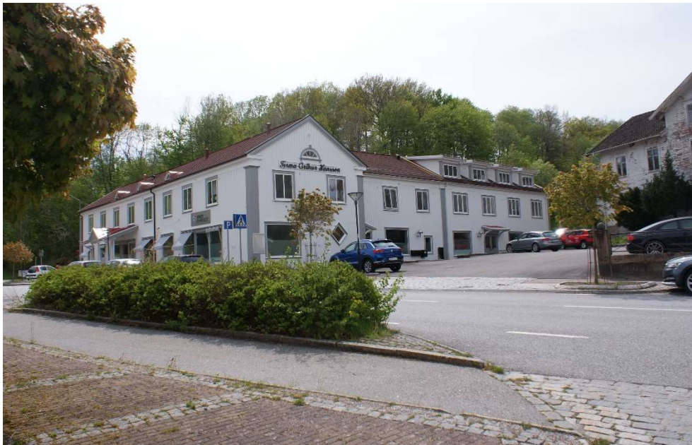
Bebyggelsen kring Munkedals station härstammar från början från 1900-talet och speglar Munkedals framväxt som centralort och kommuncentrum.

Det moderna Munkedals framväxt är ett resultat av samspelet mellan de äldre historiska epokerna, och utvecklingen under 1900-talet.