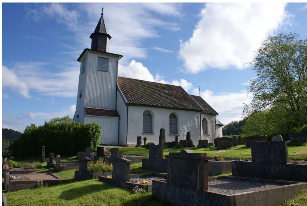
Bärfendals kyrka från 1100-talet. Kristnandet är ett av de viktigaste historiska skeendena.

Historiskt intressanta platser och miljöer är ofta exempel på hur samhället varit uppbyggt och hur människan brukat de resurser som finns på platsen. Men den historiska utvecklingen har också påverkats av viktiga händelser och utvecklingsprocesser.