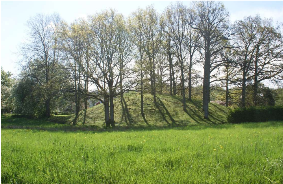
Förhistorien finns mitt inne i dagens samhälle. Tjuvehögen vid Hagarne Ringväg i Munkedal är en av Bohusläns största gravhögar.

Spåren efter förhistoriens människor finns bevarade överallt i landskapet. De första människorna kom hit så snart inlandsisen dragit sig tillbaka för mer än 10 000 år sedan. Deras boplatser finns på flera håll i kommunen, men den första boplatser som upptäcktes ligger i Hensbacka. Upptäckten var så betydelsefull att platsen fick ge namn åt en del av den västsvenska jägarstenåldern: Hensbackakulturen.