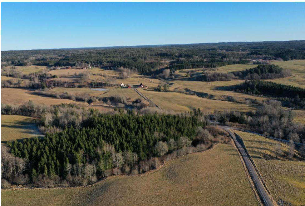
Odlingslandskapet i Örekilsälvens norra dalgång.

Kulturpräglade odlingslandskap med spår från många generationers bruk har skapat karaktären för en stor del av landsbygden i Munkedals kommun.