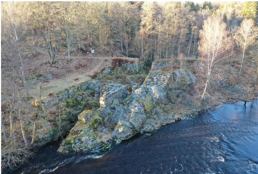
Borgmästarbruket – grunden till den vattendrivna sågen.