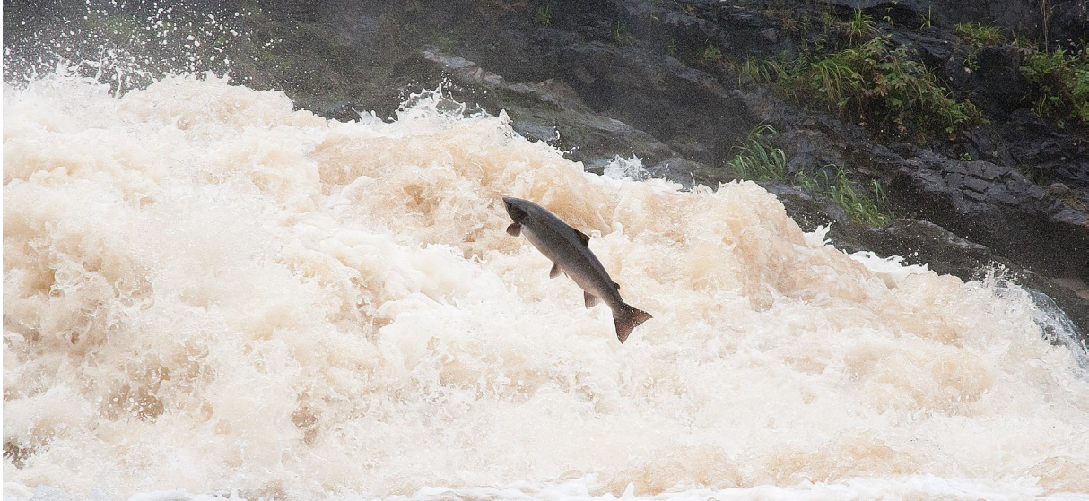
Hoppande lax Örekilsälven.