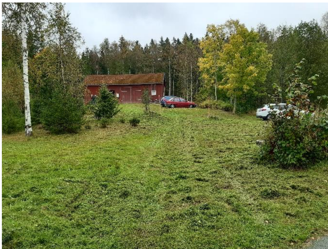
Fig. 1. Samfälligheten är belägen till höger om gårdsbyggnaden.

Fastighetsägaren ansökte 2021-09-29 om planbesked för att upphäva del av Byggnadsplanen, enligt fig. 2 . Samhällsbyggnadsnämnden har gett samhällsbyggnadsförvaltningen i uppdrag att i en planprocess pröva möjligheten att upphäva del av gällande byggnadsplan.