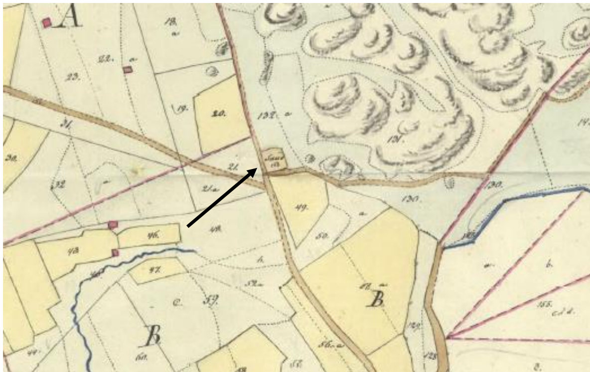
Fig. 3. Pilen visar samfällighetens lokalisering i laga skifteskartan.

Delägarna till samfälligheten redovisas i laga skiftets-akten. Möjlighet finns att det i senare förrättningar kan ha tillkommit fler delägare i samfälligheten. Vidare utredningar kring tillkomna delägare bedömer kommunen inte vara nödvändiga eftersom samfällighetens syfte med att kunna ta sand inte hindras av upphävandet. Kommunen bedömer att tillräckliga utredningar vidtagits på samfällighetens gränsdragning med hänsyn till att konsekvenserna av att upphäva parkmark i området är obetydliga.